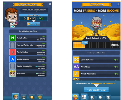
左: ヒントの矢印がついた最初のバージョン。 右: 進捗ゲージとより大きな「友達を追加」ボタンがついた最終画面。

初期導入フェーズからその後の改良フェーズに至るまで、送信される招待の数は 306%増加 し、そして インストールは364%増加 していました。また、招待されてゲームを始めたユーザーは極めて高いリテンションを示し、他のユーザーに比較すると、ライフタイムバリューも84%高くなっています。